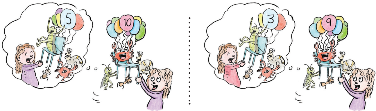
זוג מספר 1